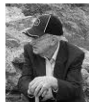
Hans H. Ørberg (1920–2010)

S lítostí oznamujeme, že ve středu 17. února 2010 ve věku 90 let zemřel Hans H. Ørberg, autor učebnic Lingua Latina per se illustrata a neúnavný propagátor latinských studií a přirozené metody výuky klasických jazyků. Až do své smrti si zachovával stále svěží mysl otevřenou novým myšlenkám a poznatkům a neustával ve svém díle, které se ještě za jeho života rozšířilo do mnoha evropských zemí a severní Ameriky. Svým lidským přístupem a pochopením pro české podmínky se velmi zasloužil o rozšíření svých učebnic i u nás. O Hansi H. Ørbergovi, jeho životě a díle se více dočtete zde .